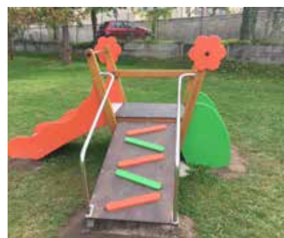
Nouveaux jeux destinées aux enfants à partir de 18 mois dans le parc de jeux Guy Colé.