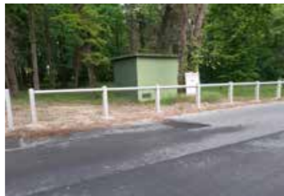
bois de chênes - suppression du poste EDF