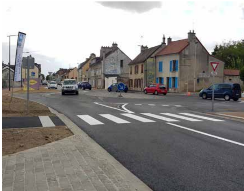
Voici un souvenir de début juillet 2020 ainsi que le résultat final.