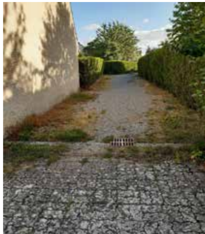
chemin traversant le boulevard de la Riolette à la rue des Framboises