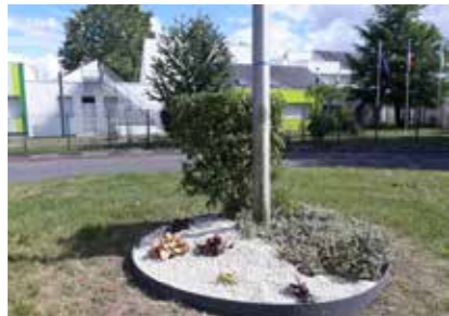
rond point du collège

Voici quelques travaux effectués et réalisés par les services techniques et la société Colas.