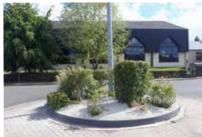
rond point du gymnase