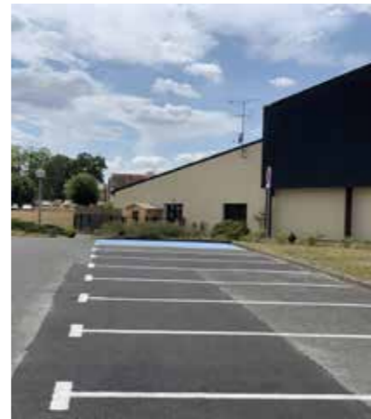
traçage du parking du gymnase et des passages piétons